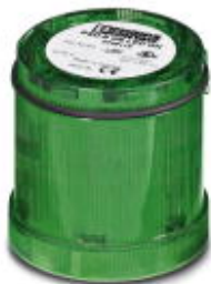
Element światła ciągłego LED, 24 V AC/DC, zielony

Należy pamiętać, że podane dane pochodzą z katalogu online. Proszę o pobranie kompletnych informacji i danych z dokumentacji użytkownika. Obowiązują ogólne warunki użytkowania dla materiałów pobieranych przez Internet. ( http://phoenixcontact.pl/download )