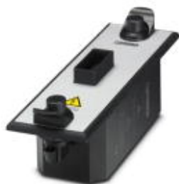
Adapter probierczy CHECKMASTER 2 do produktów serii PT oraz PLT-SEC, 17,5 mm

Należy pamiętać, że podane dane pochodzą z katalogu online. Proszę o pobranie kompletnych informacji i danych z dokumentacji użytkownika. Obowiązują ogólne warunki użytkowania dla materiałów pobieranych przez Internet. ( http://phoenixcontact.pl/download )