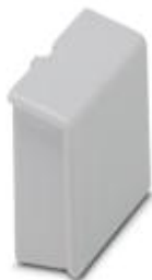
Obudowy do wbudowania, Kolor: jasnoszary

Należy pamiętać, że podane dane pochodzą z katalogu online. Proszę o pobranie kompletnych informacji i danych z dokumentacji użytkownika. Obowiązują ogólne warunki użytkowania dla materiałów pobieranych przez Internet. ( http://phoenixcontact.pl/download )