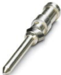
Toczony styk zaciskowy 1,6, pojedynczy styk męski, przekrój żyły 1,5 mm 2 , posrebrzony

Należy pamiętać, że podane dane pochodzą z katalogu online. Proszę o pobranie kompletnych informacji i danych z dokumentacji użytkownika. Obowiązują ogólne warunki użytkowania dla materiałów pobieranych przez Internet. ( http://phoenixcontact.pl/download )