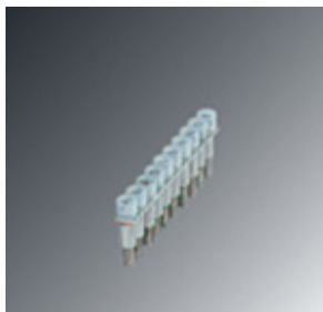
Mostek stały, Wymiar rastra: 5,2 mm, Liczba biegunów: 10, Kolor: srebrny

Należy pamiętać, że podane dane pochodzą z katalogu online. Proszę o pobranie kompletnych informacji i danych z dokumentacji użytkownika. Obowiązują ogólne warunki użytkowania dla materiałów pobieranych przez Internet. ( http://phoenixcontact.pl/download )