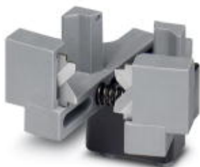
Nóż zapasowy do automatu zdejm. izol. i zacisk. CF 3000-2,5

Należy pamiętać, że podane dane pochodzą z katalogu online. Proszę o pobranie kompletnych informacji i danych z dokumentacji użytkownika. Obowiązują ogólne warunki użytkowania dla materiałów pobieranych przez Internet. ( http://phoenixcontact.pl/download )