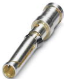
Toczony styk zaciskany 1,6, styk pojedynczy żeński, przekrój żyły 0,5 mm 2 , posrebrzany

Należy pamiętać, że podane dane pochodzą z katalogu online. Proszę o pobranie kompletnych informacji i danych z dokumentacji użytkownika. Obowiązują ogólne warunki użytkowania dla materiałów pobieranych przez Internet. ( http://phoenixcontact.pl/download )