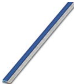
Mostki ciągłe, Długość: 500 mm, Kolor: niebieski

Należy pamiętać, że podane dane pochodzą z katalogu online. Proszę o pobranie kompletnych informacji i danych z dokumentacji użytkownika. Obowiązują ogólne warunki użytkowania dla materiałów pobieranych przez Internet. ( http://phoenixcontact.pl/download )