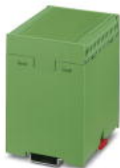
Podst. obud., ze stopą zatrzaskową

Należy pamiętać, że podane dane pochodzą z katalogu online. Proszę o pobranie kompletnych informacji i danych z dokumentacji użytkownika. Obowiązują ogólne warunki użytkowania dla materiałów pobieranych przez Internet. ( http://phoenixcontact.pl/download )