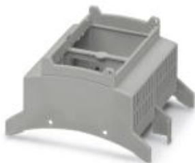
Obud. instalacyjne do zabud., Górna część, szerokość: 71,6 mm, kolor: jasnoszary (7035)

Należy pamiętać, że podane dane pochodzą z katalogu online. Proszę o pobranie kompletnych informacji i danych z dokumentacji użytkownika. Obowiązują ogólne warunki użytkowania dla materiałów pobieranych przez Internet. ( http://phoenixcontact.pl/download )