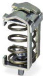
Złącze ekranu, do połączenia ekranu z przewodzącą płytą montażową

Należy pamiętać, że podane dane pochodzą z katalogu online. Proszę o pobranie kompletnych informacji i danych z dokumentacji użytkownika. Obowiązują ogólne warunki użytkowania dla materiałów pobieranych przez Internet. ( http://phoenixcontact.pl/download )