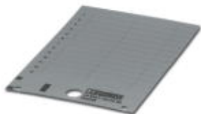
Rys. przedst. wersję artykułu

Szyld z tworzywa sztucznego, Karta, srebrny, nieopisane, opisywany przy pomocy: THERMOMARK PRIME, THERMOMARK CARD, Rodzaj montażu: Klejenie, Wielkość pola opisowego: 60 x 15 mm