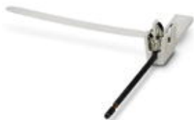
Rysunek przedstawia wariant SSA 3-6

Szybkozłącze do przyłączania ekranów kabli o średnicy 5 - 10 mm. Przewód do podłączenia potencjału: 200 mm, czarny