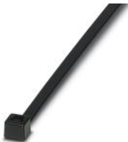
Opaski kablowe, wersja standardowa, do szybkiego i bezpiecznego wiązkania

Należy pamiętać, że podane dane pochodzą z katalogu online. Proszę o pobranie kompletnych informacji i danych z dokumentacji użytkownika. Obowiązują ogólne warunki użytkowania dla materiałów pobieranych przez Internet. ( http://phoenixcontact.pl/download )