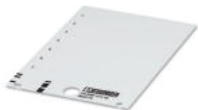
Rysunek przedstawia wariant produktu

Szyldzik zapadkowy, Karta, biały, nieopisane, opisywany przy pomocy: THERMOMARK PRIME, THERMOMARK CARD, Rodzaj montażu: zatrzaskiwać na uchwyty tabliczek, Wielkość pola opisowego: 27 × 15 mm