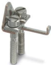
Mostek łączeniowy, Wymiar rastra: 8,2 mm, Liczba biegunów: 2, Kolor: srebrny

Należy pamiętać, że podane dane pochodzą z katalogu online. Proszę o pobranie kompletnych informacji i danych z dokumentacji użytkownika. Obowiązują ogólne warunki użytkowania dla materiałów pobieranych przez Internet. ( http://phoenixcontact.pl/download )