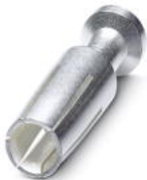
Toczony styk zaciskowy 4,0, pojedynczy styk żeński, przekrój żyły 2,50 mm 2 , posrebrzony

Należy pamiętać, że podane dane pochodzą z katalogu online. Proszę o pobranie kompletnych informacji i danych z dokumentacji użytkownika. Obowiązują ogólne warunki użytkowania dla materiałów pobieranych przez Internet. ( http://phoenixcontact.pl/download )