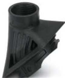
Adapter, tworzywo sztuczne, do obudowy EVO, gwint M25

Należy pamiętać, że podane dane pochodzą z katalogu online. Proszę o pobranie kompletnych informacji i danych z dokumentacji użytkownika. Obowiązują ogólne warunki użytkowania dla materiałów pobieranych przez Internet. ( http://phoenixcontact.pl/download )