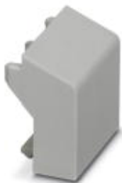
Zaślepki złączy do druku, do wolnych zacisków

Należy pamiętać, że podane dane pochodzą z katalogu online. Proszę o pobranie kompletnych informacji i danych z dokumentacji użytkownika. Obowiązują ogólne warunki użytkowania dla materiałów pobieranych przez Internet. ( http://phoenixcontact.pl/download )