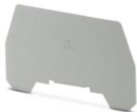
Przegroda, Długość: 72 mm, Szerokość: 0,8 mm, Kolor: szary

Należy pamiętać, że podane dane pochodzą z katalogu online. Proszę o pobranie kompletnych informacji i danych z dokumentacji użytkownika. Obowiązują ogólne warunki użytkowania dla materiałów pobieranych przez Internet. ( http://phoenixcontact.pl/download )