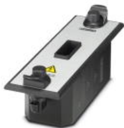
Adapter probierczy CHECKMASTER 2 do produktów serii VAL-MS

Należy pamiętać, że podane dane pochodzą z katalogu online. Proszę o pobranie kompletnych informacji i danych z dokumentacji użytkownika. Obowiązują ogólne warunki użytkowania dla materiałów pobieranych przez Internet. ( http://phoenixcontact.pl/download )