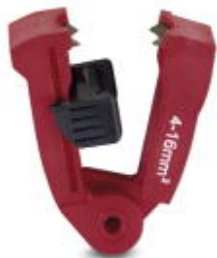
Nóż zapasowy do WIREFOX 16, do przewodów od 4 - 16 mm 2

Należy pamiętać, że podane dane pochodzą z katalogu online. Proszę o pobranie kompletnych informacji i danych z dokumentacji użytkownika. Obowiązują ogólne warunki użytkowania dla materiałów pobieranych przez Internet. ( http://phoenixcontact.pl/download )