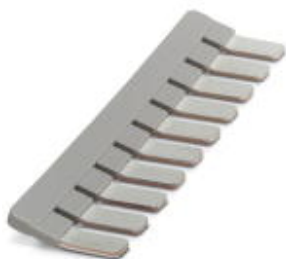
Mostek wtykany, Wymiar rastra: 15 mm, Liczba biegunów: 10, Kolor: szary

Należy pamiętać, że podane dane pochodzą z katalogu online. Proszę o pobranie kompletnych informacji i danych z dokumentacji użytkownika. Obowiązują ogólne warunki użytkowania dla materiałów pobieranych przez Internet. ( http://phoenixcontact.pl/download )