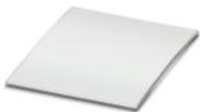
Rysunek pokazuje wariant EMPPR (27x15)

Ochrona przed dotykiem, Arkusz, przezroczysty, nieopisane, Rodzaj montażu: zatrzaskiwać na uchwyty tabliczek, Wielkość pola opisowego: 27 x 18 mm