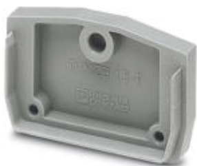
Pokrywa zamykająca, Długość: 32 mm, Szerokość: 9,9 mm, Wysokość: 22 mm, Kolor: szary

Należy pamiętać, że podane dane pochodzą z katalogu online. Proszę o pobranie kompletnych informacji i danych z dokumentacji użytkownika. Obowiązują ogólne warunki użytkowania dla materiałów pobieranych przez Internet. ( http://phoenixcontact.pl/download )