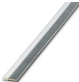
Mostki ciągłe, Długość: 500 mm, Kolor: szary

Należy pamiętać, że podane dane pochodzą z katalogu online. Proszę o pobranie kompletnych informacji i danych z dokumentacji użytkownika. Obowiązują ogólne warunki użytkowania dla materiałów pobieranych przez Internet. ( http://phoenixcontact.pl/download )