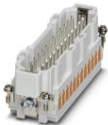
wkładka styku męskiego HEAVYCON, seria B24, 24-polowa, złącze QUICKON

Należy pamiętać, że podane dane pochodzą z katalogu online. Proszę o pobranie kompletnych informacji i danych z dokumentacji użytkownika. Obowiązują ogólne warunki użytkowania dla materiałów pobieranych przez Internet. ( http://phoenixcontact.pl/download )