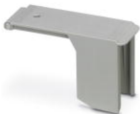
Pokrywa, Długość: 85,6 mm, Szerokość: 28,8 mm, Wysokość: 46,7 mm, Kolor: szary

Należy pamiętać, że podane dane pochodzą z katalogu online. Proszę o pobranie kompletnych informacji i danych z dokumentacji użytkownika. Obowiązują ogólne warunki użytkowania dla materiałów pobieranych przez Internet. ( http://phoenixcontact.pl/download )