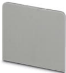
Przegroda, Szerokość: 0,5 mm, Kolor: szary

Należy pamiętać, że podane dane pochodzą z katalogu online. Proszę o pobranie kompletnych informacji i danych z dokumentacji użytkownika. Obowiązują ogólne warunki użytkowania dla materiałów pobieranych przez Internet. ( http://phoenixcontact.pl/download )