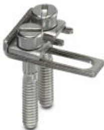
Mostek łączeniowy, Wymiar rastra: 8,2 mm, Liczba biegunów: 2, Kolor: srebrny

Należy pamiętać, że podane dane pochodzą z katalogu online. Proszę o pobranie kompletnych informacji i danych z dokumentacji użytkownika. Obowiązują ogólne warunki użytkowania dla materiałów pobieranych przez Internet. ( http://phoenixcontact.pl/download )