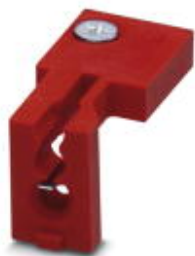
Uchwyt tulei do tulei 1,0 mm 2

Należy pamiętać, że podane dane pochodzą z katalogu online. Proszę o pobranie kompletnych informacji i danych z dokumentacji użytkownika. Obowiązują ogólne warunki użytkowania dla materiałów pobieranych przez Internet. ( http://phoenixcontact.pl/download )