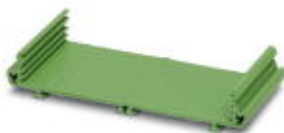
Rysunek przedstawia wersję profil UM 45 CM

Obudowa składana otwarta, Podstawa, Połączenie poprzeczne: bez złącza magistrali, Kolor: zielony, Szerokość: 1000 mm, Ilość biegunów - łącznik poprzeczny: nie dotyczy, Uwaga: potrzebna długość profilu = długość PCB - 3,6 mm