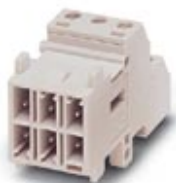
Moduł wkładki stykowej, do ramy do zabudowy, ze złączem śrubowym, 6-polowy, 250 V / 10 A

Należy pamiętać, że podane dane pochodzą z katalogu online. Proszę o pobranie kompletnych informacji i danych z dokumentacji użytkownika. Obowiązują ogólne warunki użytkowania dla materiałów pobieranych przez Internet. ( http://phoenixcontact.pl/download )