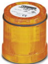
Element światła ciągłego, 24 V AC/DC, żółty

Należy pamiętać, że podane dane pochodzą z katalogu online. Proszę o pobranie kompletnych informacji i danych z dokumentacji użytkownika. Obowiązują ogólne warunki użytkowania dla materiałów pobieranych przez Internet. ( http://phoenixcontact.pl/download )