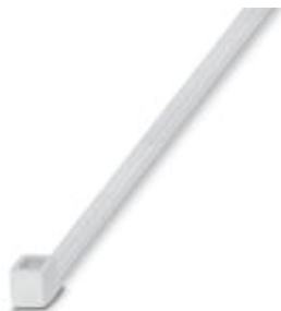
Opaski kablowe, wersja standardowa, do szybkiego i bezpiecznego wiązkania

Należy pamiętać, że podane dane pochodzą z katalogu online. Proszę o pobranie kompletnych informacji i danych z dokumentacji użytkownika. Obowiązują ogólne warunki użytkowania dla materiałów pobieranych przez Internet. ( http://phoenixcontact.pl/download )