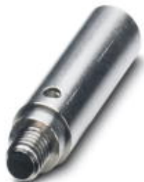
Gniazdo testowe, Kolor: srebrny

Należy pamiętać, że podane dane pochodzą z katalogu online. Proszę o pobranie kompletnych informacji i danych z dokumentacji użytkownika. Obowiązują ogólne warunki użytkowania dla materiałów pobieranych przez Internet. ( http://phoenixcontact.pl/download )