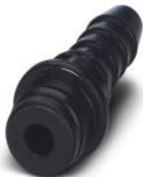
Wtyk pneumatyczny, do modułu HC-M-PN3, wewnętrzna średnica węża 4,0 mm

Należy pamiętać, że podane dane pochodzą z katalogu online. Proszę o pobranie kompletnych informacji i danych z dokumentacji użytkownika. Obowiązują ogólne warunki użytkowania dla materiałów pobieranych przez Internet. ( http://phoenixcontact.pl/download )