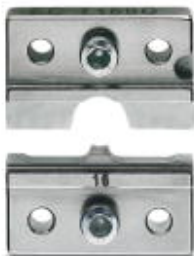
Matryca do automatu zaciskowego CF 500, do nieizolowanych końcówek kabli (C-RC... i C-FC...) 16 mm 2

Należy pamiętać, że podane dane pochodzą z katalogu online. Proszę o pobranie kompletnych informacji i danych z dokumentacji użytkownika. Obowiązują ogólne warunki użytkowania dla materiałów pobieranych przez Internet. ( http://phoenixcontact.pl/download )