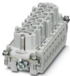
Wkładka styków żeńskich HEAVYCON, seria B16, 16-pinowa, nadruk 17 ... 32, zacisk śrubowy

Należy pamiętać, że podane dane pochodzą z katalogu online. Proszę o pobranie kompletnych informacji i danych z dokumentacji użytkownika. Obowiązują ogólne warunki użytkowania dla materiałów pobieranych przez Internet. ( http://phoenixcontact.pl/download )