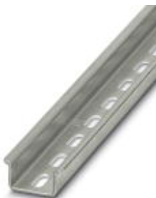
Szyna montażowa NS 35

Należy pamiętać, że podane dane pochodzą z katalogu online. Proszę o pobranie kompletnych informacji i danych z dokumentacji użytkownika. Obowiązują ogólne warunki użytkowania dla materiałów pobieranych przez Internet. ( http://phoenixcontact.pl/download )