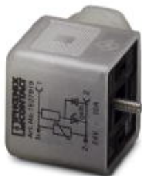
wtyk zaworowy, 3-polowy, typ A, 1 LED, z oprzewodowaniem ochronnym, złącze śrubowe, dławnica kablowa Pg9

Należy pamiętać, że podane dane pochodzą z katalogu online. Proszę o pobranie kompletnych informacji i danych z dokumentacji użytkownika. Obowiązują ogólne warunki użytkowania dla materiałów pobieranych przez Internet. ( http://phoenixcontact.pl/download )