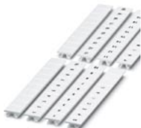
Taśma oznaczników, 10-częściowa, nadruk podłużny z kolejnymi liczbami: 11 ... 20, biały, Szerokość: 8 mm

Należy pamiętać, że podane dane pochodzą z katalogu online. Proszę o pobranie kompletnych informacji i danych z dokumentacji użytkownika. Obowiązują ogólne warunki użytkowania dla materiałów pobieranych przez Internet. ( http://phoenixcontact.pl/download )