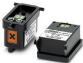
Nabój, wymienny, 28 ml farby UV, czarny plus kartusz do czyszczenia

Należy pamiętać, że podane dane pochodzą z katalogu online. Proszę o pobranie kompletnych informacji i danych z dokumentacji użytkownika. Obowiązują ogólne warunki użytkowania dla materiałów pobieranych przez Internet. ( http://phoenixcontact.pl/download )