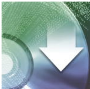
Licencja mGuard Secure VPN Client

Należy pamiętać, że podane dane pochodzą z katalogu online. Proszę o pobranie kompletnych informacji i danych z dokumentacji użytkownika. Obowiązują ogólne warunki użytkowania dla materiałów pobieranych przez Internet. ( http://phoenixcontact.pl/download )