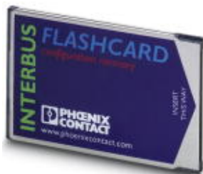
Pamięć programu i konfiguracji, 2 MB

Należy pamiętać, że podane dane pochodzą z katalogu online. Proszę o pobranie kompletnych informacji i danych z dokumentacji użytkownika. Obowiązują ogólne warunki użytkowania dla materiałów pobieranych przez Internet. ( http://phoenixcontact.pl/download )