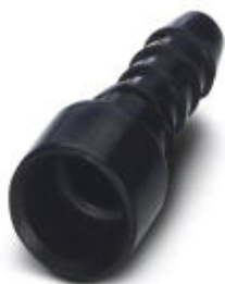
Gniazdo pneumatyczne, do modułu HC-M-PN3, wewnętrzna średnica węża 4,0 mm

Należy pamiętać, że podane dane pochodzą z katalogu online. Proszę o pobranie kompletnych informacji i danych z dokumentacji użytkownika. Obowiązują ogólne warunki użytkowania dla materiałów pobieranych przez Internet. ( http://phoenixcontact.pl/download )