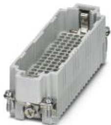
Wkładka styków męskich HEAVYCON, seria DD108, 108-pinowa, złącze zaciskane

Należy pamiętać, że podane dane pochodzą z katalogu online. Proszę o pobranie kompletnych informacji i danych z dokumentacji użytkownika. Obowiązują ogólne warunki użytkowania dla materiałów pobieranych przez Internet. ( http://phoenixcontact.pl/download )