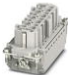
Wkładka żeńska HEAVYCON, seria B16, 16 + PE pinowa, złącze typu push-in