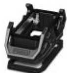
Profile do PCB HEAVYCON EVO z tworzywa sztucznego, B16, z uchwytem poprzecznym, wysokość 30,5 mm, z uszczelką płaską