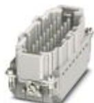
Wkładka męska HEAVYCON, seria B16, 16 + PE pinowa, złącze typu push-in