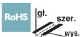
Rysunek przedstawia wariant PLC-BSC-24DC/21

Złącza gniazdowa PLC 6,2 mm do ochrony przed prądami lub napięciami zakłócającymi po stronie sterowania z połączeniem śrubowym, bez przekaźników elektromechanicznych lub półprzewodnikowych, do montażu na szynie nośnej NS 35/7,5, ze zwiększonym poborem prądu wejściowego, 1 zestaw przelączny, napięcie wejściowe 24 V DC