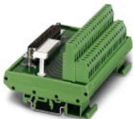
Rysunek przedstawia wariant FLKM-D37 SUB/S

Należy pamiętać, że podane dane pochodzą z katalogu online. Proszę o pobranie kompletnych informacji i danych z dokumentacji użytkownika. Obowiązują ogólne warunki użytkowania dla materiałów pobieranych przez Internet. ( http://phoenixcontact.pl/download )